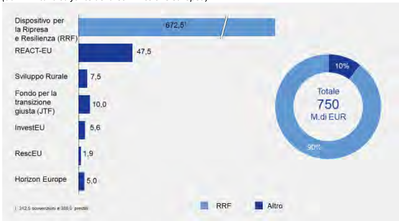
Figura n. 1 – Next Generation Eu – Dispositivi e risorse disponibili, in miliardi di euro (da Pnrr Italia su fonte della Commissione europea)

Il Regolamento europeo per la gestione del Rrf ( Recovery and Resilience Facility ) ha individuato sei grandi aree di intervento (pilastri), per diversi aspetti interconnesse, sui quali i Piani nazionali si devono focalizzare: